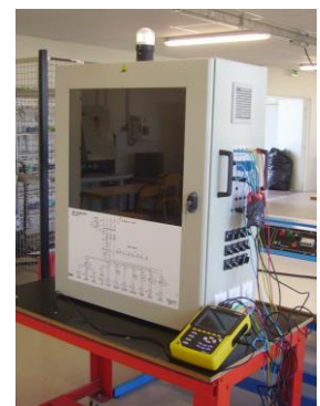
Etude de la qualité de l'énergie électrique