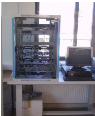
Les équipements communicants