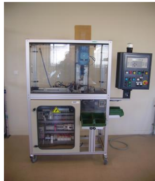
Etude de système (paramétrage, configuration)