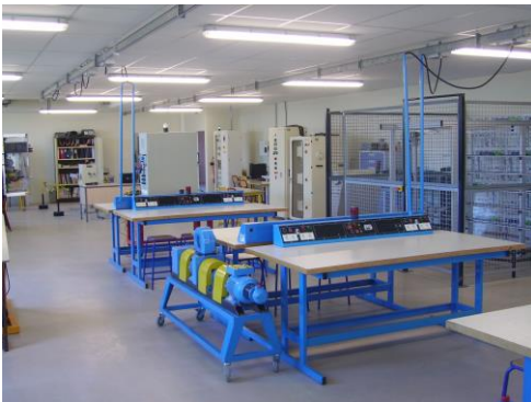
Atelier d'électrotechnique mesures et systèmes