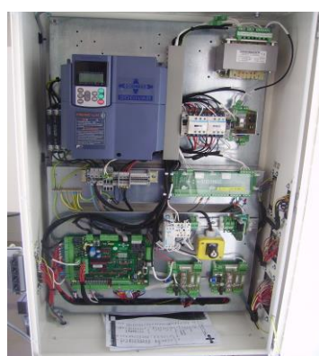
L'électronique de puissance et la variation de vitesse de moteur